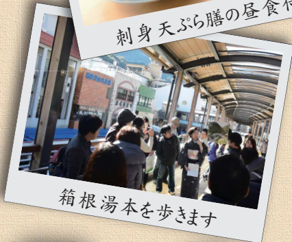
箱根湯本を歩きます