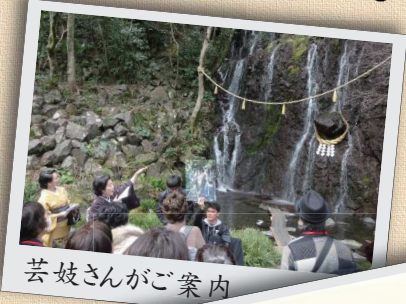
芸妓さんがご案内

箱根といえは関東の有名な観光地ですが、その玄関口箱根湯本の街は普段通り過ぎてしまうことが多いかと思えます。 このツアーでは、そんな箱根湯本のあまり知られていないスポットを芸妓さんによる地元ならではのガイドにて徒歩で巡ります。