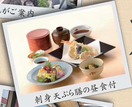
刺身天ぷら膳の昼食付