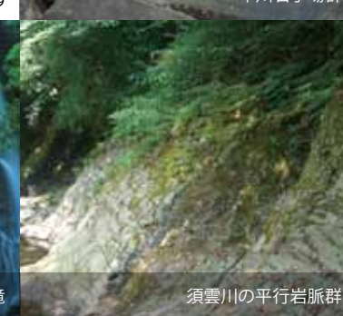
須雲川の平行岩脈群