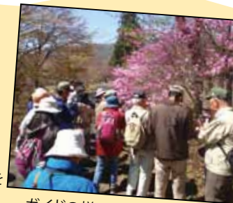
ガイドの様子（ミニ観察会）

✓ 多彩なウォーキングコース 四季折々の草花（木）に出会える散策路はおすすめです。 また、ちょっと健脚の方には、箱根外輪山の峰々からの眺望もおすすめ！