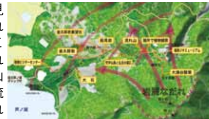
神山と流れ山との位置関係図

この周辺には、巨大な岩の塊がいくつもあり、金太郎岩、船見岩などと呼ばれていますが、これは岩屑なだれで流れてきた山体の一部で「流れ山」といわれるものです。