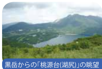
黒岳からの「桃源台(湖尻)」の眺望