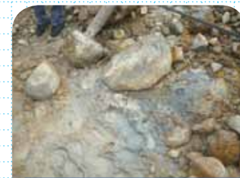
大涌谷自然探勝歩道付近の温泉余土