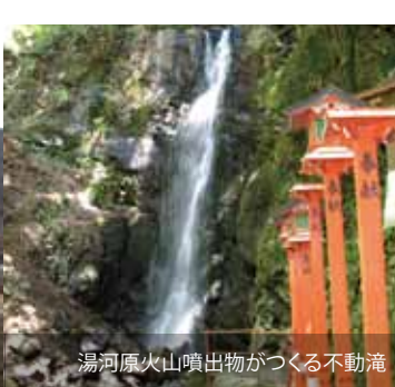
湯河原火山噴出物がつくる不動滝