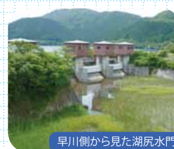
早川側から見た湖尻水門