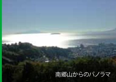
南郷山からのパノラマ