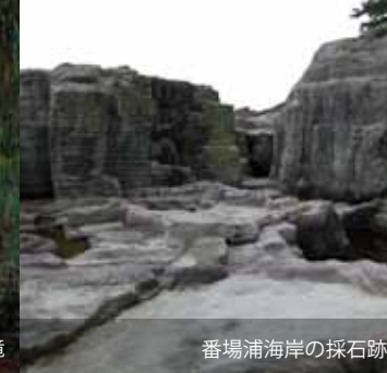
番場浦海岸の採石跡