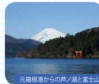
元箱根港からの芦ノ湖と富士山

江戸時代は箱根も深良村（現在の静岡県裾野市）も小田原藩の領地でした。その後両地は明治の廃藩置県で神奈川県（足柄県）と静岡県に分割され、湖尻峠が県境となりました。