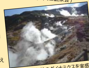
大涌谷の噴気地のダイナミクスを実感