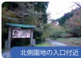
北側園地の入口付近

好きなルートを選び、気軽に歩いて、箱根の豊かな自然を楽しむために、ビジターセンター周辺にはコースが整備されています。県道の西側には、「子供広場」「野鳥の森」「白百合園地」、南側には「花の広場」「50周年広場」等が整備されています。