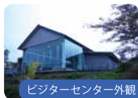
ビジターセンター外観