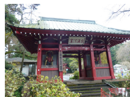
最乗寺仁王門からはじまる 杉並木(天狗の小径)