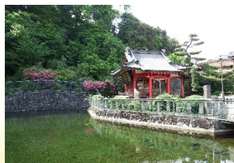
平成の名水百選 清左衛門地獄池