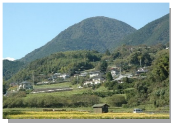
南足柄のランドマーク 矢倉岳