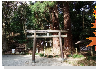
県指定文化財の社叢林 御嶽神社